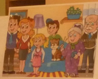
Мы должны беречь друг друга